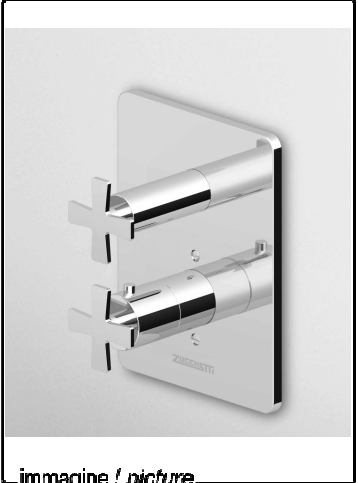
immagine / picture

Termostatico doccia incasso da 3/4" 3/4" Built-in thermostatic shower mixer descrizione / description