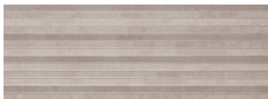
Relieve Modus Perla 25x70 / 10"x28"