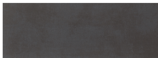
Modus Antracita 25x70 / 10"x28"