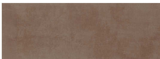
Modus Moka 25x70 / 10"x28"