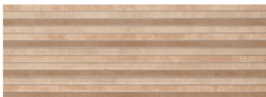
Relieve Modus Arena 25x70 / 10"x28"