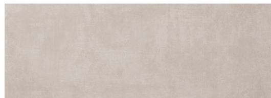
Modus Perla 25x70 / 10"x28"