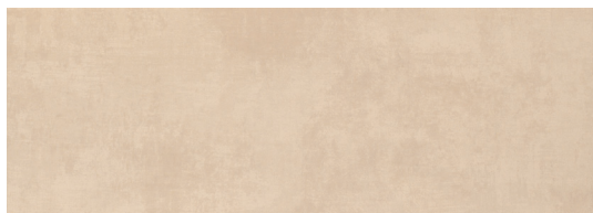
Modus Arena 25x70 / 10"x28"