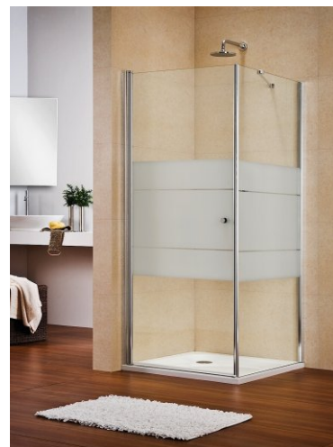
Рисунок: GPT1W + GFPW