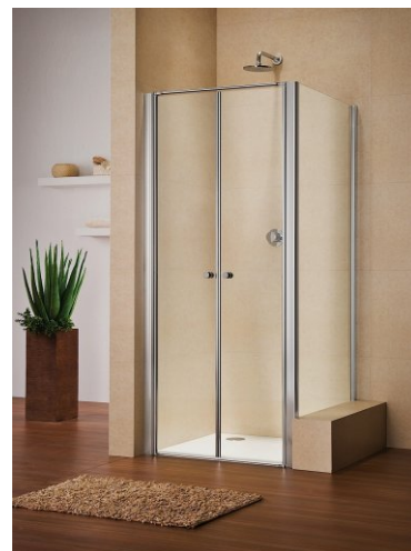
Рисунок: GPT2N + GPWW