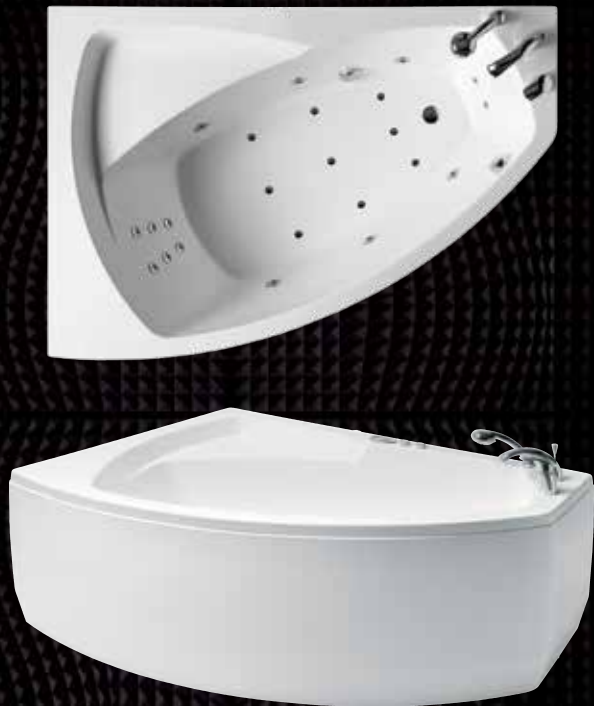
Правая / левая На фотографии изображена правосторонняя ванна